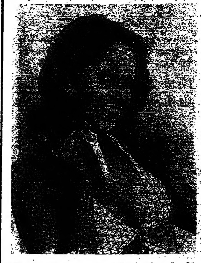
ملكة جمال بريطانيا السليمة كاتي الدردي ترويها مثيرا بعد تقطعها الأولى منه ، لكنها تصيف الى الأثر الجمالية الأثر الأمامي ، فهي تحمل في يديها التي سامية تفتت بقلوب الجنويات ، وتضع في أصبع يدها الكبري خلسا بامسما ، هسهل الصورة ، حقله كاتي على جعلها والكابره ، واسترجاع الصالح لحيثه الفنية جدا .